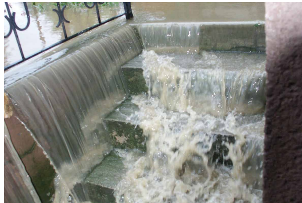
Eine kluge Liegenschaftsentwässerung hilft, keine unliebsamen Erfahrungen mit dem Abwasser machen zu müssen.